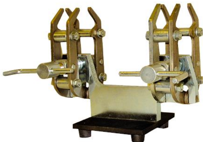
«Accu-Fit» с подставкой D240-ST